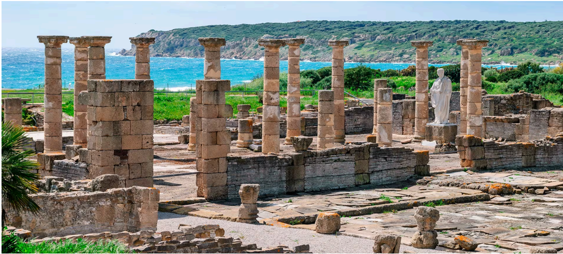
Baelo Claudia, en Cádiz

SANTI: Pues, a ver, si queremos hacer un recorrido 28 por la historia de la provincia. O sea 29 , en orden cronológico, yo creo que la primera visita obligada 30 sería las ruinas 31 de Baelo Claudia, que es un yacimiento romano que se encuentra en la en el término municipal 32 de Tarifa.